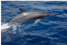
Dauphins à long bec Plus au large, réputés pour leurs vrilles !