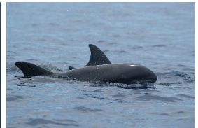
Dauphins Electre plutôt en haute mer

Et d'autres mammifères marins également :