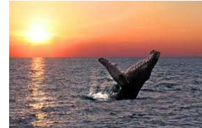
La baleine à bosse