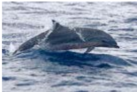
Dauphins de Fraser avec un ventre rose