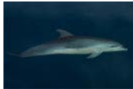
Le grand dauphin qui peut mesurer 4m