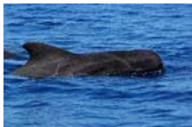
Le globicéphale tropical

Et d'autres mammifères marins également :