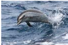
Dauphins tachetés Le plus courant Il vit en groupe

Plusieurs espèces de dauphins sont observables en Martinique :